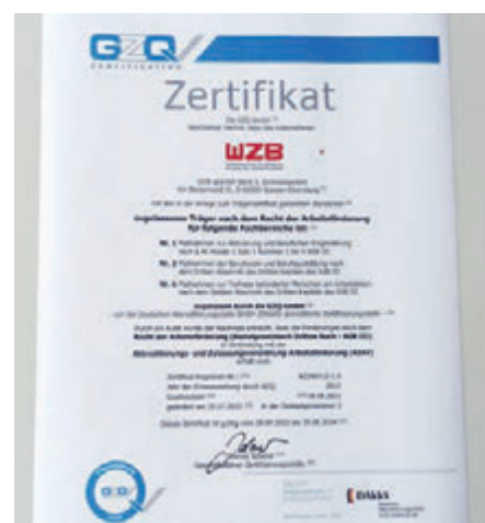
Das AZAV-Zertifikat des WZB

Durch die Anpassungen im Sozialgesetzbuch (SGB) IX ist die Werkstatt für die Teilnehmer*innen des Berufsbildungsbereiches keine „Einbahnstraße“. Sie können sich in der Werkstatt über die praktische Arbeit weiter qualifizieren. Förderprogramme wie das „Budget für Arbeit“ und das „Budget für