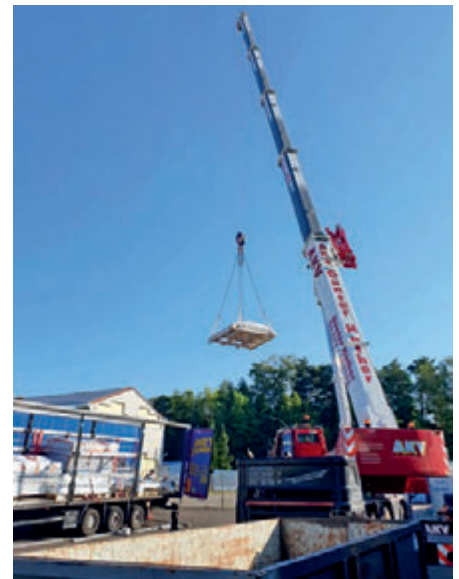
Anlieferung der neuen RWA-Elemente

Wie bei den meisten Bauvorhaben in der heutigen Zeit, sind auch wir von Lieferengpässen und Preissteigerungen betroffen. Aktuell fehlen zahlreiche elektronische Komponenten für beide Projekte. Auch personelle Ausfälle bei allen beteiligten Unternehmen erschweren das Voranschreiten.