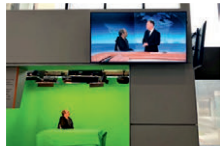
Die „Grüne Box“ des ZDF