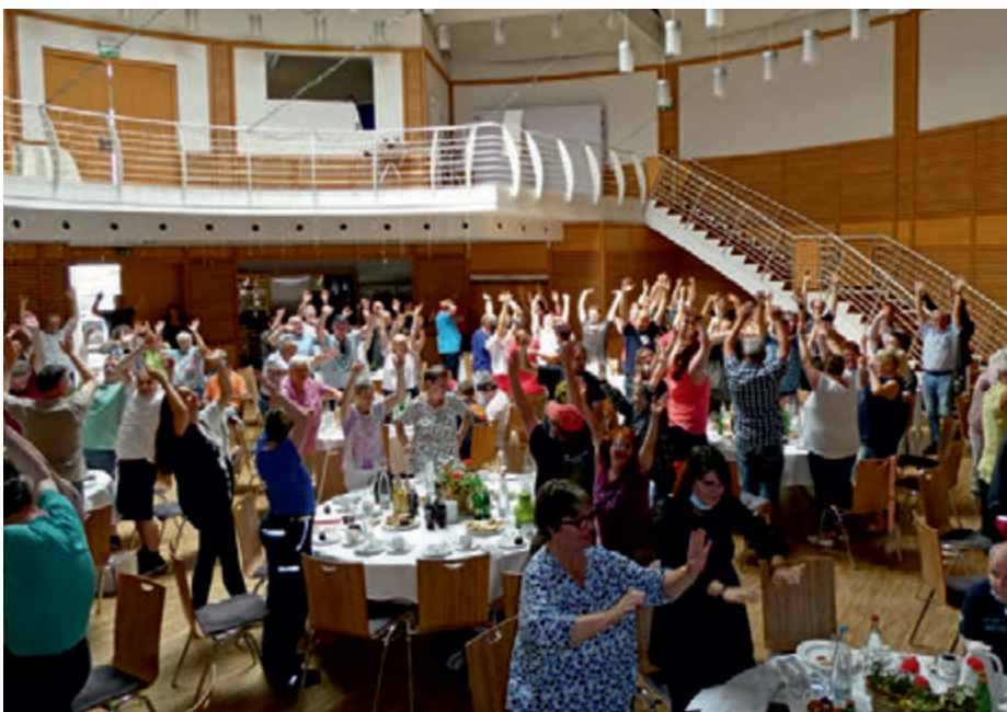
„WZB in Bewegung“ beim Wort genommen

Am 28. Juli ehrte die WZB in der Eventhalle des CFK langjährige Mitarbeiter aus den Werken II, III und IV. Die Veranstaltung war eine Ersatzfeier für die Ehrung des Jahres 2021, die pandemiebedingt ausgefallen war. Werk I und der Wendelinushof hatten ihre Jubilare bereits separat geehrt.