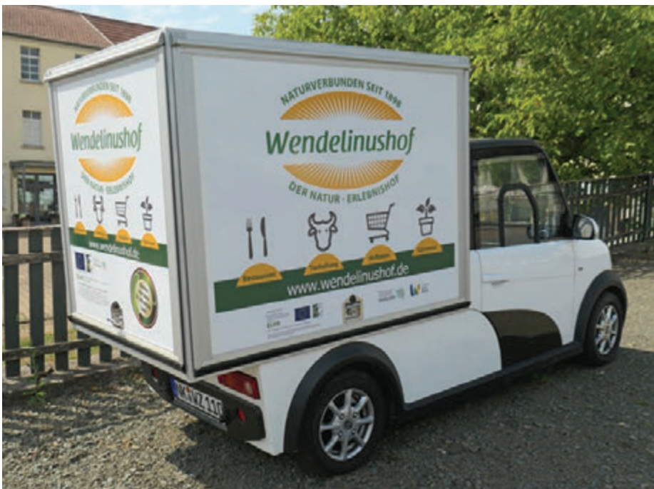
Unser mobiler Info- und Marketingwagen, welcher seit Anfang Oktober 2022 im St. Wendeler Land unterwegs ist.

Der Wendelinus-Hof hat seit Oktober ein Elektro-Fahrzeug. Das Fahrzeug soll zum Beispiel bei Festen oder auf Märkten eingesetzt werden. Mit dem Fahrzeug werden Produkte vom Hof angeboten. Oder auch Informations-Material über den Hof.