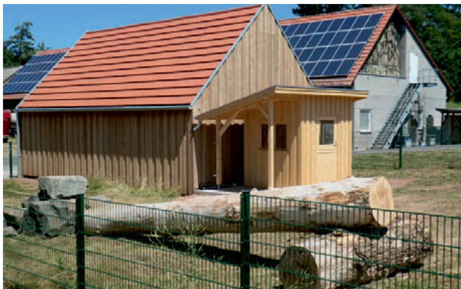
Der neu erbaute Ziegenstall

Die Herzogin-Luise Stiftung der Kreisstadt St. Wendel hat dieses Projekt mit 10.000 € gefördert – wofür sich das Team Wendelinushof bei dem Stiftungsrat sehr herzlich bedankt.