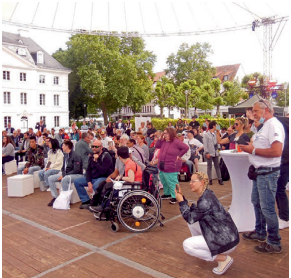
Werkstättentag 2022 auf dem Ludwigsplatz in Saarbrücken

Der Werkstättentag in Saarbrücken war bereits für das Jahr 2020 geplant, fiel jedoch der Corona-Pandemie zum Opfer. In diesem Jahr trafen sich rund 2000 Teilnehmer in der saarländischen Landeshauptstadt, um sich auf Vorträgen und Workshops zu informieren und auszutauschen. Diese fanden unter anderem in der Saarland- und der Congresshalle statt. Auf dem Ludwigsplatz hatte die Landesarbeitsgemeinschaft für behinderte Menschen im Saarland e. V. zum kulturellen Rahmenprogramm mit zahlreichen Attraktionen eingeladen, das von den saarländischen Werkstätten gestaltet wurde. SR-Moderator Thomas Braml führte an vier Tagen durch die Veranstaltung, die vom saarländischen Sozialminister Dr. Magnus Jung, offiziell eröffnet wurde. Der Platz mit der