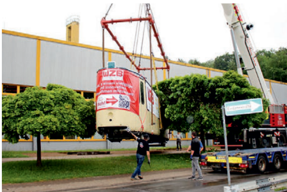
Die Straßenbahn wird zu ihrem Platz gehoben

Am frühen Freitagmorgen bereits begannen die Vorbereitungen zum Transport des Kurz-Gelenktriebwagens GT4N (N steht dabei für Normalspur) durch die Transportfirma AKV aus Zweibrücken. Mitarbeiter des Unternehmens und der NVG hatten alle Hände voll zu tun, bis die Schienen geschnitten waren und die Straßenbahn am Haken hing. Gegen Mittag war es dann soweit: Festgezurt auf einem Spezialtieflader war das historische Personennahverkehrsmittel bereit für eine