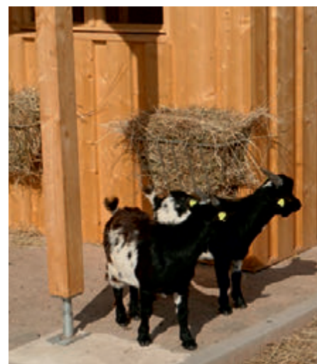
An der Heuraufe

Weiterhin bietet dieses Projekt für unsere Mitarbeiter*innen mit Beeinträchtigung die Möglichkeit, Tiere in einem direkten, nahen und persönlichen Umfeld zu betreuen, zu pflegen und zu versorgen. So lässt sich die individuelle Förde-