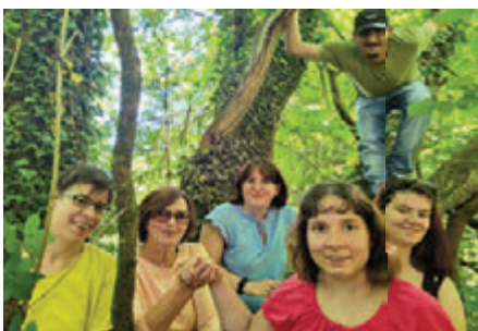
„Hilf mit - Waldaktion“: Gruppenbild in romantischer Umgebung

Zusammengefasst wurden die Erlebnisse des Tages in der gemeinsam verfassten Schrift „Waldspaziergang“, in deren Zentrum die Abenteuer einer Mäusemutter stehen.