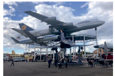
Im Technikmuseum in Speyer

auch Studios, welche zu diesem Zeitpunkt nicht belegt waren. Das Gelände, auf dem sonntags der Fernsehgarten stattfindet, wurde auch besichtigt. Der Höhepunkt war aber die Grüne Box! Ausführliche Informationsgespräche, Zeit für Fragen und Antworten sowie ein gemeinsames Mittagessen im ZDF-Kasino rundeten den Besuch ab.