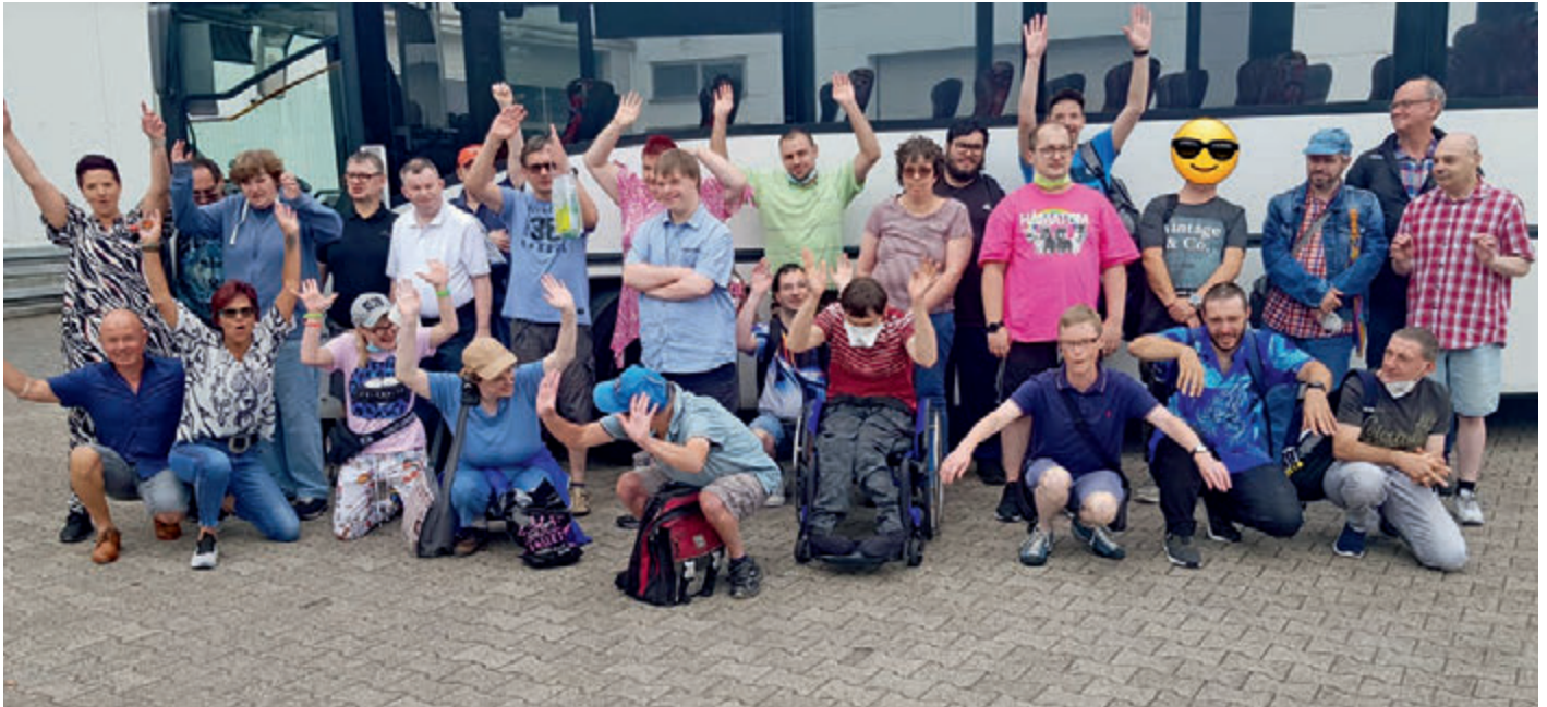
Vor der Abfahrt nach Amnéville