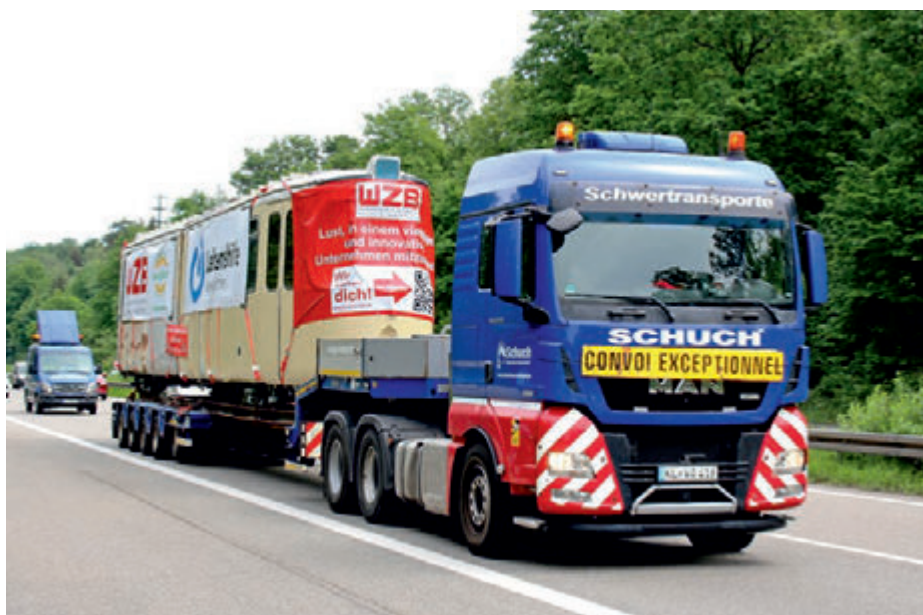
Auf der Autobahn

Mühlental und die Spieser Hauptstraße, ging es für den Transporter und seine Begleitfahrzeuge schließlich durch den Kreisel Beckerwald zum Ziel vor Werk I. Bei einsetzendem Regen erlebten einige Schaulustige nun, wie die Straßenbahn routiniert mit einem Autokran auf ihren vorläufigen Standplatz gehoben wurde.