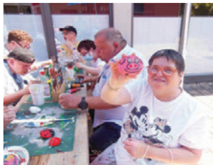
„Hilf mit - Steine“: Unterschiedliche Ergebnisse als Ausdruck der Individualität