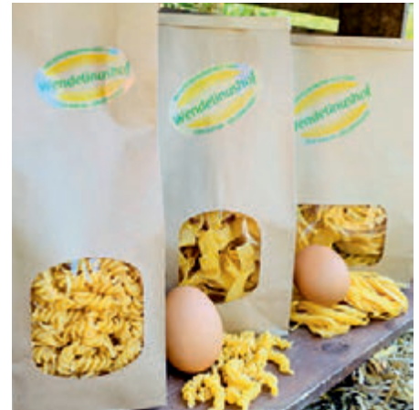
Frischeinudeln aus Weizengrieß vom Wendelinushof

Die jetzige Produktionsstätte stellt eine Übergangslösung dar. Geplant ist, die Fertigung angrenzend zur Hofküche zu etablieren, um so die Transportwege möglichst kurz zu halten. Erweitert werden soll schrittweise die Produktpalette, bei entsprechendem Umfang perspektivisch auch mit einer neuen Gruppe von Werkstattbeschäftigten.