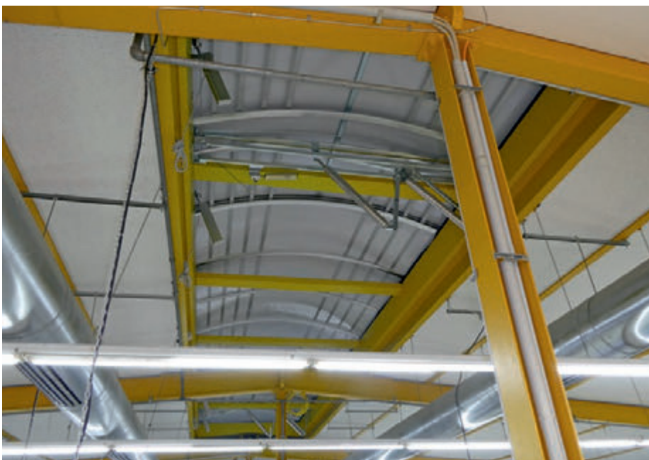
Die neue Rauch- und Wärmeabzugsanlage (RWA) ist montiert

Einige der großen Teilziele wurden jedoch erreicht. Die neue