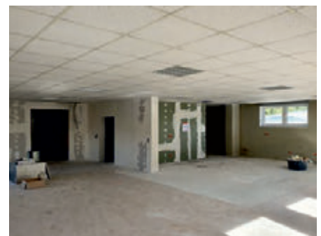
Neu gestalteter Kantinenbereich im Bau