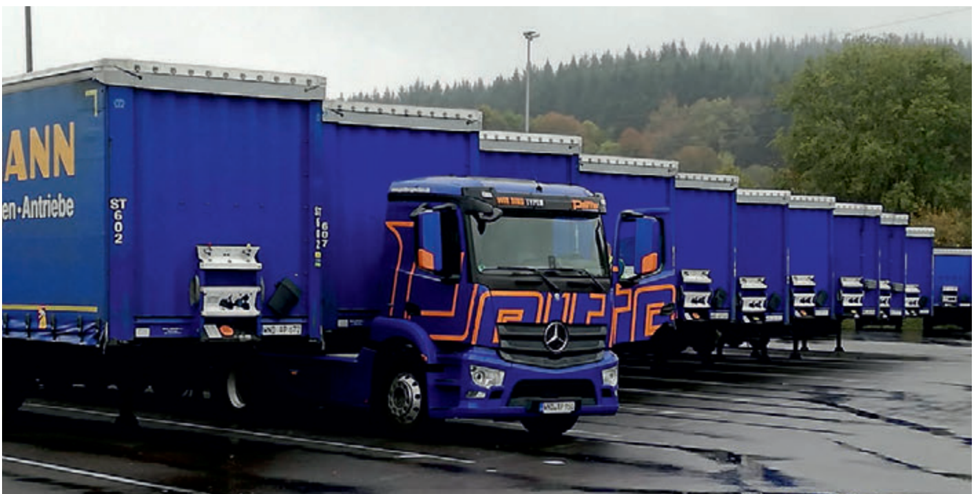
Fuhrpark der Adolf Peiffer GmbH